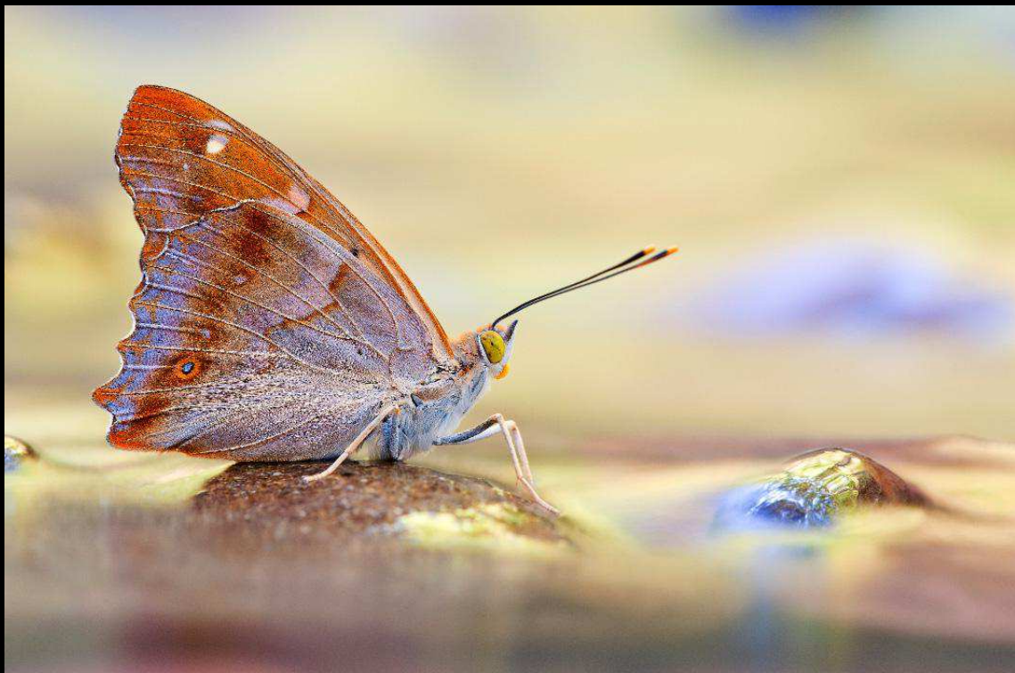
"On the water" - Apatura ilia, Toscana, parco dell'Orecchiella

Nikon D700; 150 mm; 6,0 sec; f 14; iso 200