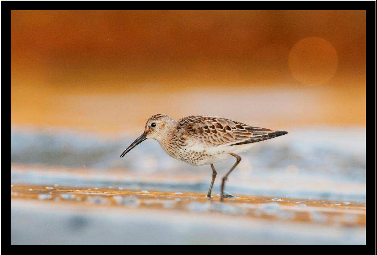
"Road runner" - Piovanello pancianera, Toscana, litorale versiliese

Nikon D300s; 500 mm; 1/200 sec; f 7,1; iso 400