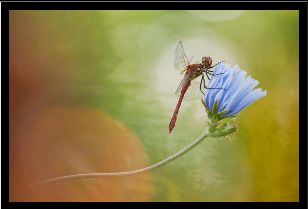
"Softness" - Sympetrum foscolumbii, Toscana, Versilia

Nikon D300s; 500 mm; 1/200 sec; f 7,1; iso 400