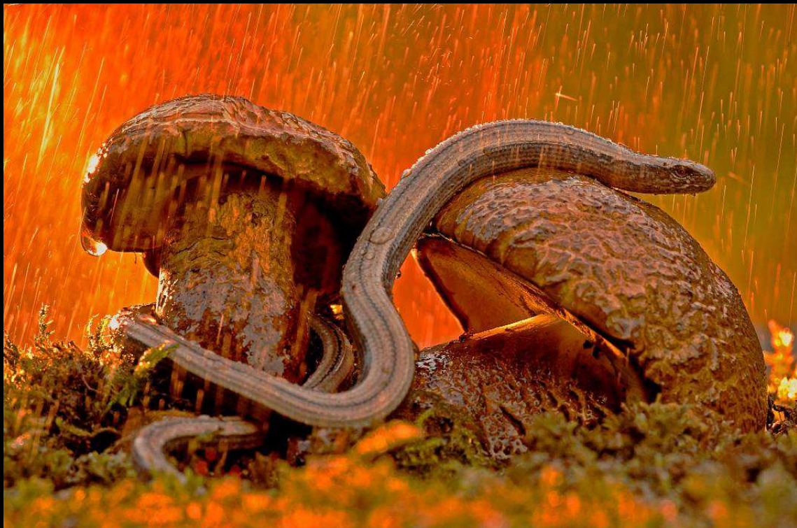
"Slowworm" - Orbettino, Toscana, Lido di Camaiore

Nikon D700; 150 mm; 6,0 sec; f 14; iso 200