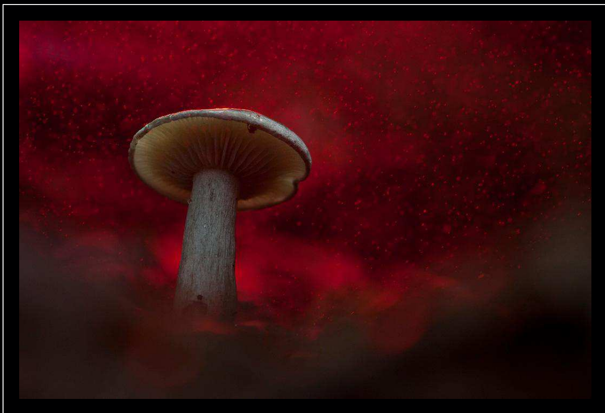
“Red passion” - Tricholoma spp., Toscana, parco Alpi Apuane

“ Nelle mie fotografie cerco di dominare sul campo le regole della luce, cercando nuovi trucchi e nuove idee per sfruttare tutto quanto madre natura mi mette a disposizione nel suo meraviglioso set ”