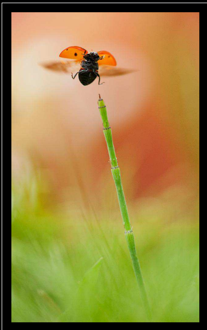
"Fly to myself" - Coccinella quadripunctata, Toscana

Nikon D700; 150 mm; 1/1250 sec; f 5,0; iso 1000