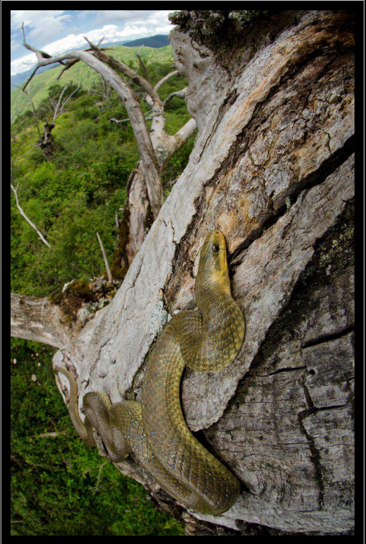
"The last airbender" - Saettone comune, Toscana, parco Appennino Tosco Emiliano

Nikon D7000; 10 mm; 1/320 sec; f 14; iso 640